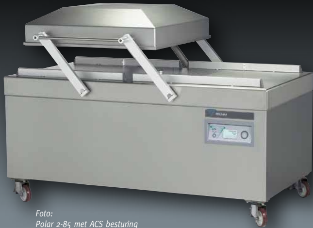
Foto: Polar 2-85 met ACS besturing