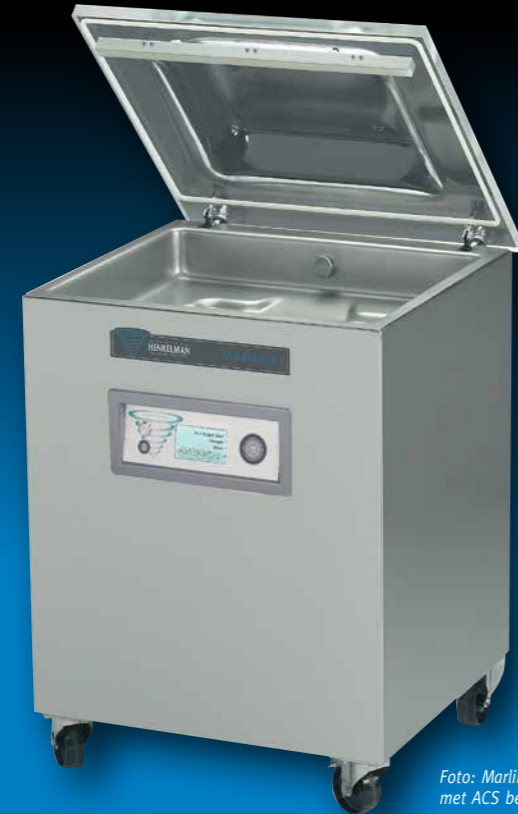
Foto: Marlin 52 met ACS besturing