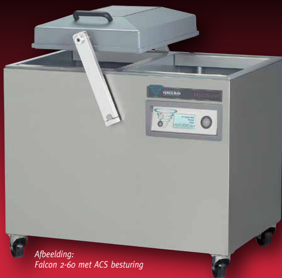
Afbeelding: Falcon 2-60 met ACS besturing