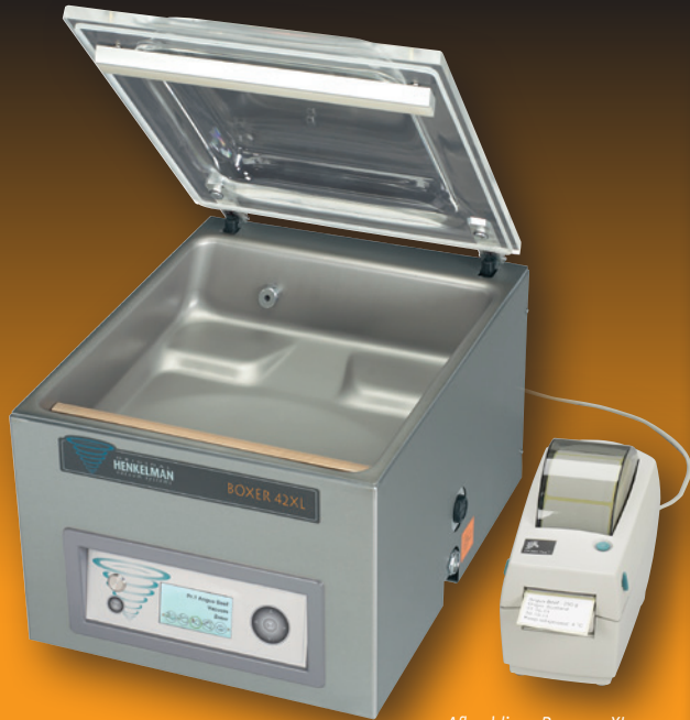
Afbeelding: Boxer 42XL met optie ACS en printer