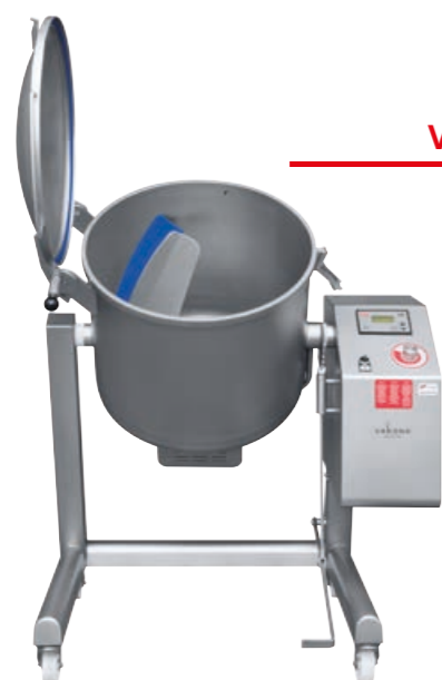
VM 150 STL

The machines captivate with a high user-friendliness, which is achieved by their easy operation and simple cleaning. A huge individualization of the machines is reached by a wide range of equipment options, in order to achieve the highest possible degree of customer-specific product optimization.