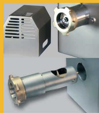
Abbildung zeigt optionale Ausstattungsvariante Picture shows optional accessory

Elevated floor-model with outlet discharge 800 mm for use e.g. of a bowl.